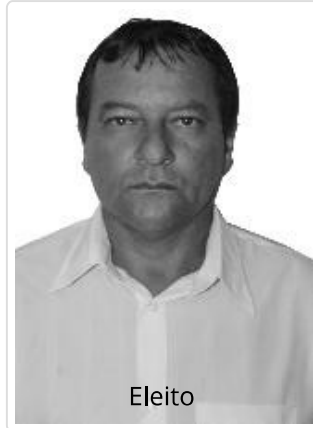
Foto para urna